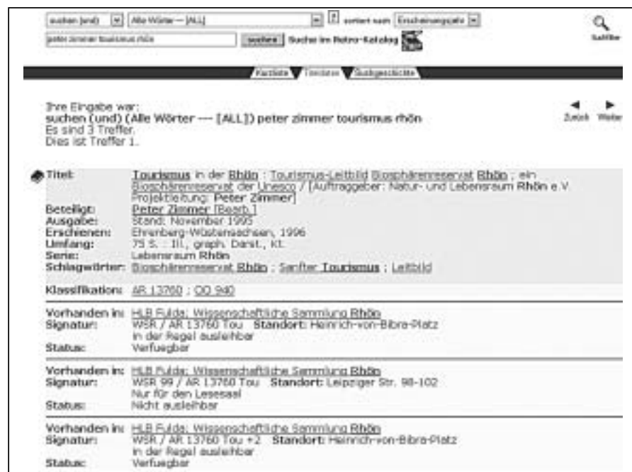
Abb. 5: Titelanzeige im HLB-Online- Katalog

Moderne Online-Kataloge bieten die Möglichkeit, neben der Standortsignatur weitere Notationen als Suchelemente aufzunehmen und somit die Bedeutung der Klassifikation im Online-Katalog zu