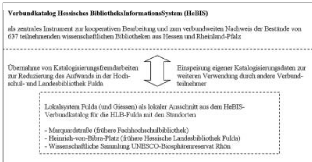
Abb. 3: Teilnahme der Wissenschaftlichen Sammlung am HeBIS-Verbundkatalog

In allen Teilen Deutschlands gibt es Katalogverbundsysteme, die teilweise auch mehrere Bundesländer umfassen. In jüngerer Zeit haben sich die Verbundsysteme von Katalogisierungs- und Rechercheinstrumenten hin zu bibliothekarischen Dienstleistungsanbietern entwickelt, z.B. mit angeschlossener Fernleihe und elektronischen Dokumentlieferdiensten. Neben HeBIS existieren zur Zeit in Deutschland der Bibliotheksverbund Bayern (BVB), der Kooperative Bibliotheksverbund Berlin-Brandenburg (KOBV), der Gemeinsame Bibliotheksverbund (GBV) für Bremen, Hamburg, Mecklenburg-Vorpommern, Niedersachsen, Sachsen-Anhalt, Schleswig-Holstein und Thüringen, der Nordrhein-Westfälische Bibliotheksverbund (HBZ) mit großen Teilen von Rheinland-Pfalz und der Südwestdeutsche Bibliotheksverbund (SWB) für Baden-Württemberg, das Saarland und Sachsen.