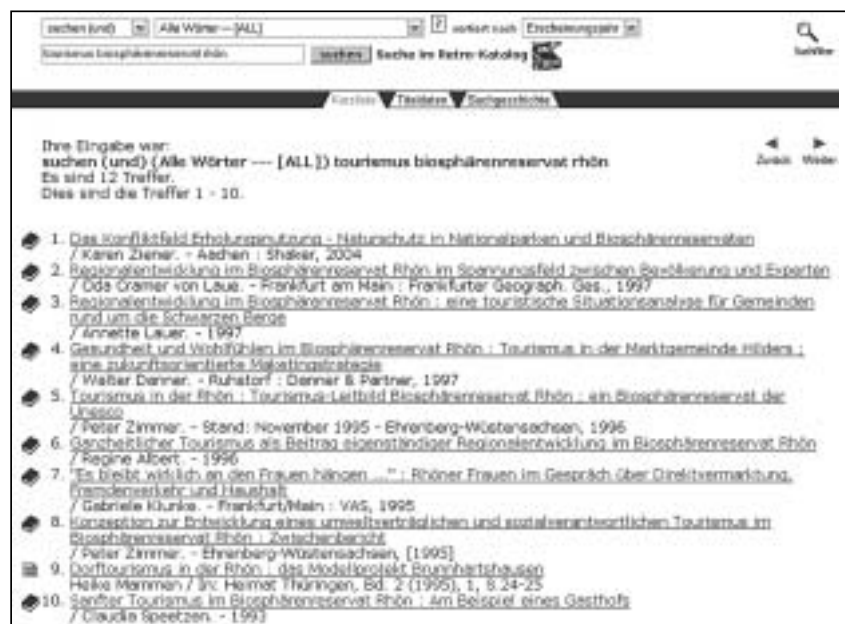
Abb. 2: Ausschnitt aus dem Bestand der Wissenschaftlichen Sammlung (Online-Katalog)

Die Wissenschaftliche Sammlung nutzt das Integrierte Bibliothekssystem der HLB Fulda zur Erfassung, Verwaltung und Erschließung ihrer Bestände. Über eine Codierung lässt sich der WSR-Bestand aus dem HLB-Gesamtbestand einfach herausfiltern (Eingabe in der Suchmaske: bso 200) oder kombiniert mit Titeldaten oder Schlagwörtern gezielt recherchieren. Der Katalog ist unter der URL http://www.fh-fulda.de/hlb/ zu erreichen.