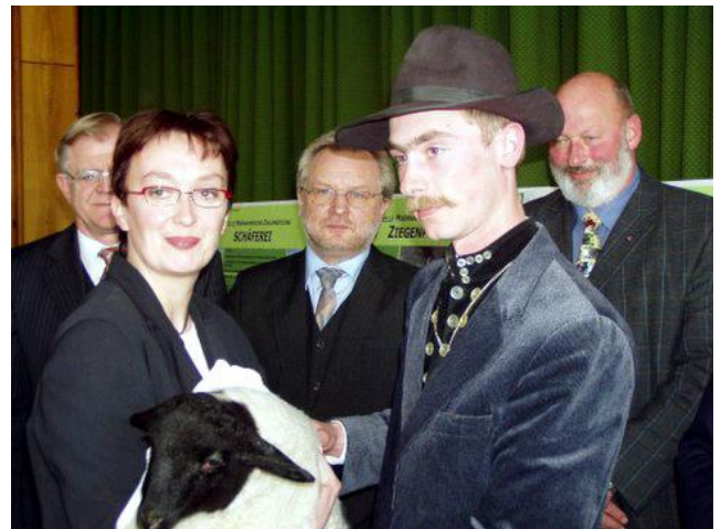
Staatssekretärin Astrid Klug mit Rhönschaf und Schäfer

Nach erfolgreichem Abschluss der Planungsphase (Phase 1) des Naturschutzgroßprojektes „Thüringer Rhönhutungen“ kann jetzt die 2. Phase gestartet werden. Am 24. März wurde durch die Parlamentarische Staatssekretärin im Bundesumweltministerium, Astrid Klug, durch den Präsidenten des Bundesamtes für Naturschutz, Prof. Hartmut Vogtmann, und durch den Thüringer Minister für Landwirtschaft, Naturschutz und Umwelt, Dr. Volker Sklenar, ein Fördermittelbescheid von 5 Millionen EURO an den Projektträger Landschaftspflegeverband BR Thür. Rhön e. V. übergeben.